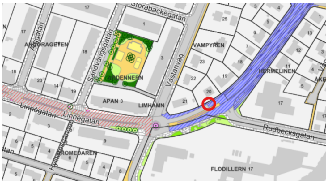
Bild över berörd sträcka. Röd markering visar på föreslagen placering av nytt farthinder.