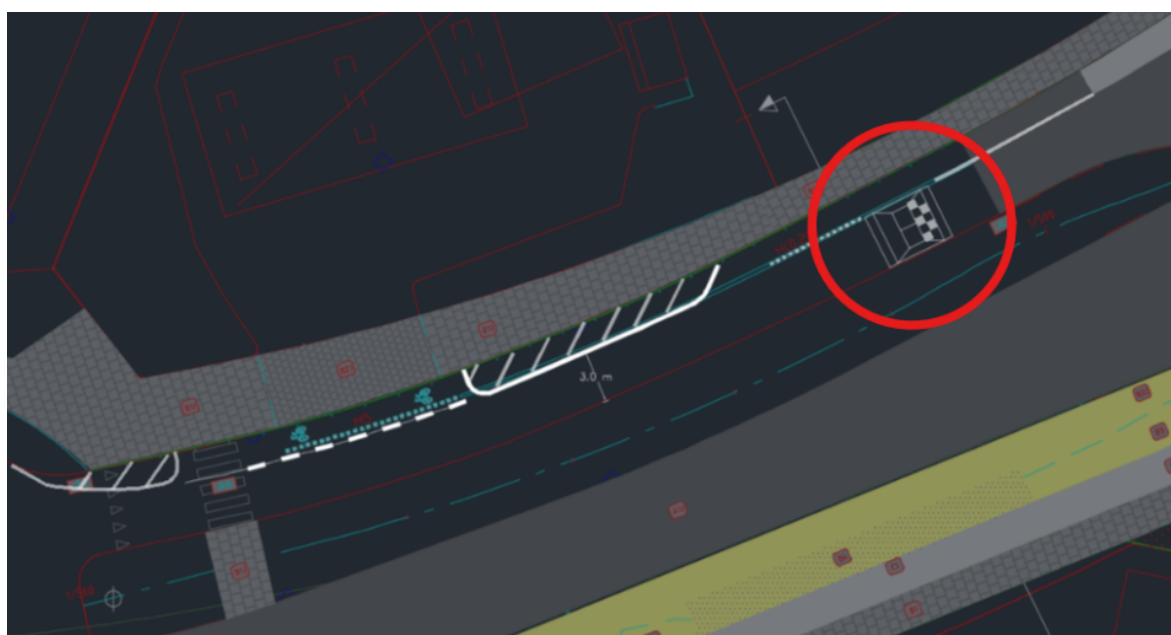
Bild över föreslagen utformning med tillkommande farthinder markerat i rött.

På platsen föreslås busskuddar i asfalt. Åtgärden är anpassad för högre komfort för kollektivtrafiken samtidigt som den är kostnadseffektiv och dämpar hastigheterna på ett bra sätt. Åtgärden kommer att öka trafiksäkerheten vid övergångsstället för gående som korsar gatan.